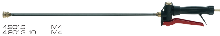
4.901.3 M4 4.901.3 10 M4